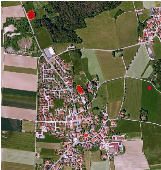
unmaßstäblich

Die aufgefundenen Gegenstände und der Fundort sind bis zum Ablauf von einer Woche nach der Anzeige unverändert zu belassen, wenn nicht die Untere Denkmalschutzbehörde die Gegenstände vorher freigibt oder die Fortsetzung der Arbeiten gestattet.