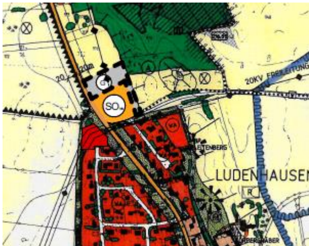
Ausschnitt aus dem Entwurf zur Änderung Flächennutzungsplan, unmaßstäblich

Das Bebauungsplanverfahren wird im regulären Verfahren durchgeführt. Der Flächennutzungsplan wird im Parallelverfahren gem. § 8 Abs. 3 BauGB im Rahmen der 9. Änderung entsprechend geändert.