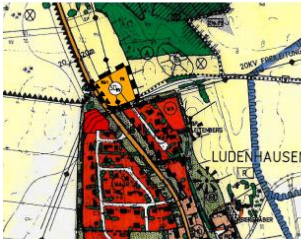
Auszug aus dem wirksamen Flächennutzungsplan der Gemeinde Reichling, unmaßstäblich